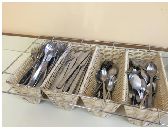
Söögisaalis väga tore söögiriistade hoidja.