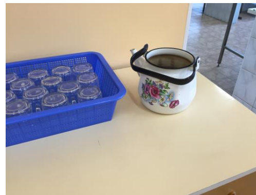
Lihtsalt armas kann.