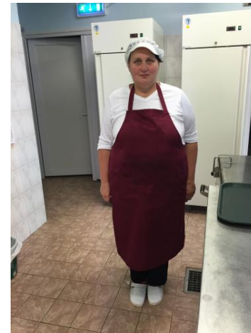
Kokk korrektselt riides