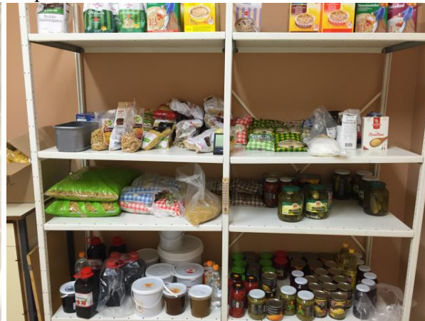
Ladu korrektne, omatehtud hoidised.