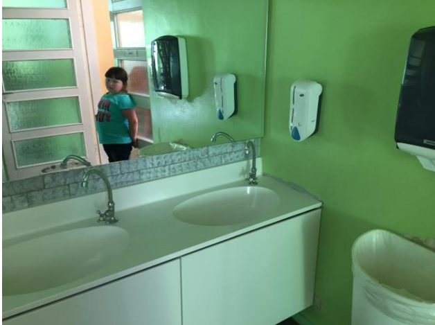
Kätepesu võimalused korrektsed.