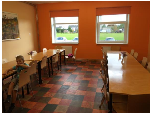
Kaunis renoveeritud söögisaal.