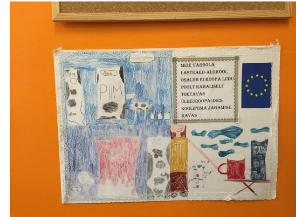
Koolipiima ja – puuviljaprogrammi tore teavitus.