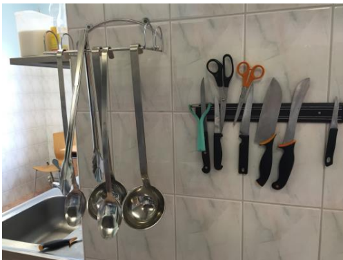
Noad magnetribal, kulbid ripuvad.